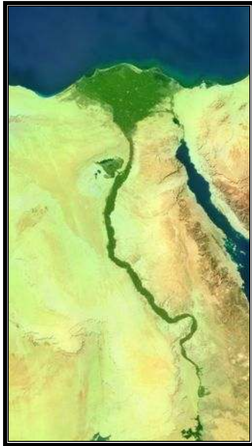
“Valle del Nilo”.

La vida se ordenaba entorno al desarrollo de un sistema de escritura y de una literatura independientes, así como en un cuidado control estatal sobre los recursos naturales y humanos, caracterizado sobre todo de la irrigación del fértil valle del Nilo y la explotación minera del valle y de las regiones desérticas circundantes, la organización de proyectos colectivos, el comercio con las regiones vecinas de África del este y central y con las del mediterráneo oriental y finalmente, por empresas militares que mantuvieron una hegemonía imperial y la dominación territorial de civilizaciones vecinas en diversos períodos. La motivación y la organización de estas actividades dependía de una élite sociopolítica y económica que alcanzó consenso social por medio de un sistema basado en creencias religiosas, bajo la dirección del Faraón un personaje semi-divino, generalmente masculino, perteneciente a una sucesión de dinastías, no siempre del mismo linaje.