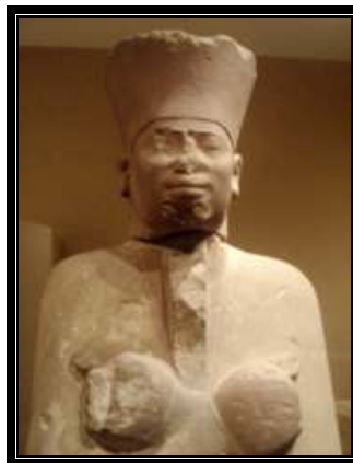
Mentuhotep II. MMNY

La dinastía V marca el ascenso del alto clero y los influyentes gobernadores locales, (nomarcas), y durante el largo reinando de Pepy II se acentuará una época de fuerte descentralización, denominada primer periodo intermedio de Egipto. Son las dinastías III a VI.