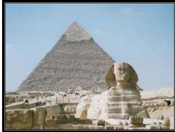
“Pirámide de Jafra y la Gran Esfinge de Giza”.

El Antiguo Egipto fue una civilización que se originó a lo largo del cauce medio y bajo del río Nilo, y que alcanza tres épocas de esplendor faraónico en los periodos denominados: Imperio Antiguo, Imperio Medio, e Imperio Nuevo. Alcanzaba desde el delta del Nilo en el norte, hasta Elefantina, en la primera catarata del Nilo, en el sur, llegando a tener influencia desde el Éufrates hasta Jebel Barkal , en la cuarta catarata del Nilo, en épocas de máxima expansión. Su territorio también abarcó, en distintos periodos, el desierto oriental y la línea costera del mar Rojo, la península del Sinaí, y un gran territorio occidental dominando los dispersos oasis. Históricamente, fue dividido en Alto y Bajo Egipto, al sur y al norte respectivamente. ( Véase: Kemet )