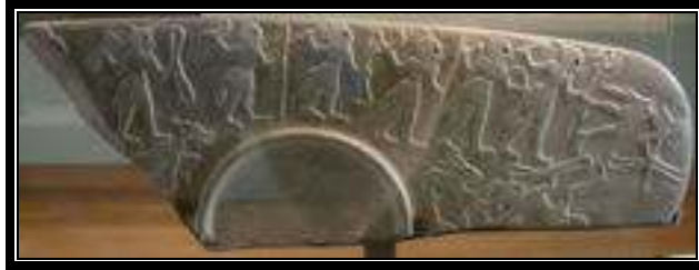
“Paleta ceremonial de época protodinástica”. Louvre

Considerado la fase final del periodo predinástico, también conocido como dinastía 0, predinástico tardío, o periodo Naqada III. Esta regido por gobernantes del Alto Egipto que residirán en Tinis, se hacen representar con un serej y adoran a Horus. El nombre de estos reyes figura en la Piedra de Palermo, grabada 700 años después. En este periodo surgen las primeras auténticas ciudades, tales como Tinis, Nubet, Nejob, Nejen, etc. Son típicos de esta época los magníficos vasos tallados en piedra, cuchillos y paletas ceremoniales, o las cabezas de mazas votivas. Narmer pudo ser el último rey de esta época, y el fundador de la dinastía I.