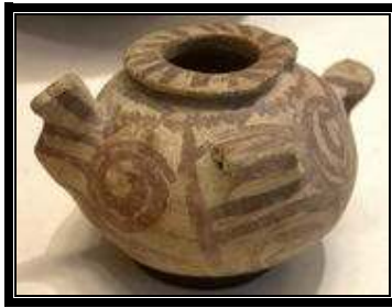
“Vasija de terracota con forma de ave. (Naqada II”). Louvre.

Las sucesivas fases del neolítico están representadas por las culturas de El Fayum, hacia el 5000 adC, la cultura Tasiense, hacia el 4500 adC y la cultura de Merimde, hacia el 4000 adC. Todas ellas conocen la piedra pulimentada, la cerámica, la agricultura y la ganadería. La base de la economía era la agricultura; esta se realizaba aprovechando el limo, fertilizante natural que aportaban las anuales inundaciones del río Nilo.