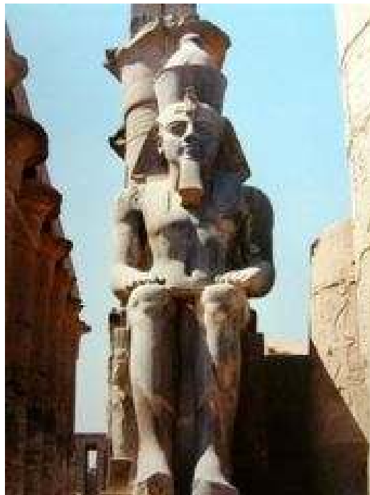
“Ramsés II. Imperio Nuevo. Luxor”.

Durante este periodo irrumpieron en Egipto los hicsos, pobladores de origen semita, que se establecieron en el delta, y tuvieron como capital la ciudad de Avaris. Son las dinastías XIII a XVII, parcialmente coetáneas.