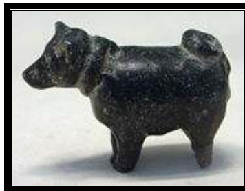
“Perro de piedra amratiense”. Louvre

Los primeros pobladores de Egipto alcanzaron las riberas del río Nilo, por entonces un conglomerado de marismas y foco de paludismo, en su huida de la creciente desertización del Sáhara.