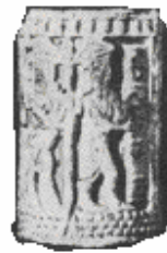
Fig. # 3. En la dura piedra está grabado el dibujos, cuando se hizo rodar sobre una tableta de blanda arcilla, que se muestra a la izquierda. En la otra tableta aparecen una choza de juncos y varios animales. Podría representar una escena de un cuento sobre la vida de los pastores a la orilla del Eufrates o ser, sencillamente, el inventario de una granja.

Los egipcios aprendieron este arte, también desde tiempos remotos, y empezaron a dar a sus gemas forma de escarabajos; y a esas piedras se las conoce, precisamente por eso, con el nombre de "escarabajos". Pero a sus artistas se los recuerda mejor por su labor en madera y en piedra. Al principio, adornaban sus muebles con tallas. Hacían grandes imágenes de sus reyes en madera y cincelaban en la piedra monstruosos animales, como las esfinges, ver Figura #4. Esculpieron sobre sus tumbas y templos muchos dibujos e inscripciones en relieve, es decir, haciendo sobresalir apenas las figuras sobre el fondo.