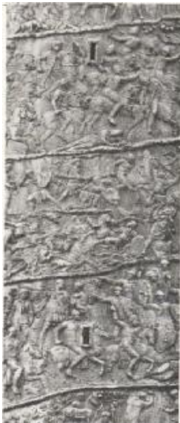
Fig. 5. Abajo se ve el detalle de uno de los monumentos más hermosos que se hayan elevado para celebrar el triunfo de un gran emperador. Se trata de la columna de Trajano, que se yergue en su toro, en Roma, y en la cual sus numerosas victorias están representadas en un bajorrelieve continuo, que asciende en espiral alrededor del fuste.

El tallado de las piedras preciosas pasó de Grecia a Roma, con las demás artes. En los tiempos en que Roma se convertía de república en imperio, estaba de moda coleccionar gemas. Julio César regaló seis grandes colecciones a un templo de Roma, así como los magnates modernos regalan libros a las bibliotecas o cuadros a los museos. Se afirma que Marco Antonio desterró a un senador porque no quería cederle una piedra preciosa grabada, que lo entusiasmaba ver figura # 5.