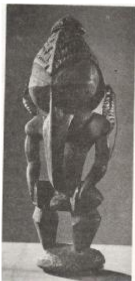
Fig. #1. Este ídolo de Nueva Guinea, con su nariz que asemeja el pico de un ave de rapiña, inspira pavor

Más célebres son aún las tallas de las tribus negras del Congo y otros sitios de África, y de los pueblos de algunas islas de los mares del Sur