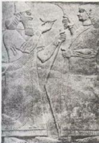
Fig. #4 Este bajorrelieve muestra a Assurbanipal, el poderoso rey de Asirla, cuando se dispone a tomar una copa de vino. Un respetuoso cortesano está ahuyentando las moscas que se atreven a molestar a su majestad.

Los cretenses, que colonizaron las costas del Mar Egeo siglos antes de comenzar la historia de Grecia, hicieron muchas cosas bellas en marfil y se deleitaron cincelandos gemas. Y desde luego, los propios griegos, en el período de su máximo esplendor, sobresalieron en el tallado, como en todas las demás artes. Nadie ha hecho jamás mejores estatuas, y quizá pueda considerarse que algunas de sus obras escultóricas destacadas son, en realidad, tallas, ya que suelen ser de madera cubierta de oro y marfil tallados. La famosa estatua de Atenea en el Partenón se hizo en el siglo V AC. y su cabello, las facciones y la suntuosa vestidura estaban hechos con placas talladas de marfil y oro.