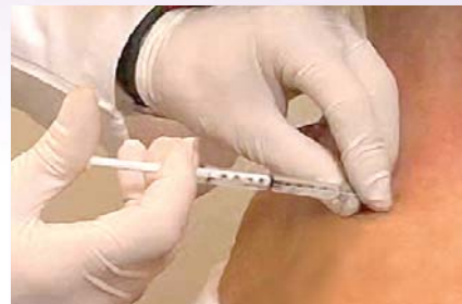
Las inyecciones de BOTOX® serán administradas en el consultorio médico.

¿Cuánto tardan en verse los resultados? No mucho. Podría empezar a ver la mejoría en los síntomas a los pocos días (unas pocas semanas en algunas afecciones) de haber recibido el tratamiento con BOTOX® y quizá no tenga que volver a consulta para recibir otra inyección en hasta 3 meses. 1