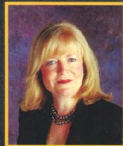
Sharon L. Lechter: Mujer de negocios, contadora pública certificada (CPA), madre.

Sharon L. Lechter, co-autora de Padre Rico, Padre Pobre ; Niño Rico, Niño Listo y El cuadrante del Flujo de Dinero .