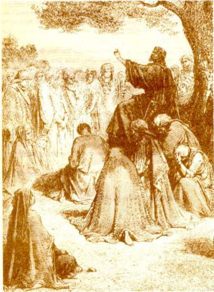
Grabado de Gustav Doré (1832-1883)