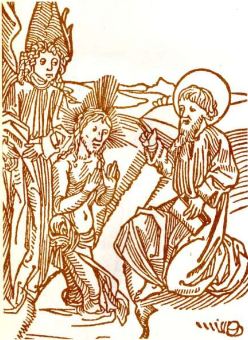
Xilografía de Alberto Dürero (1471-1528)