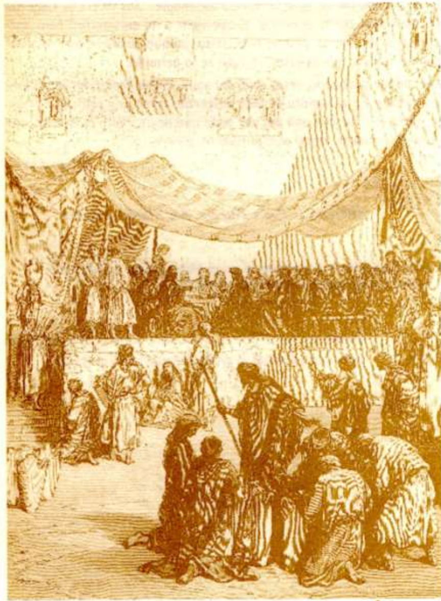
Grabado de Gustav Doré (1832-1883)