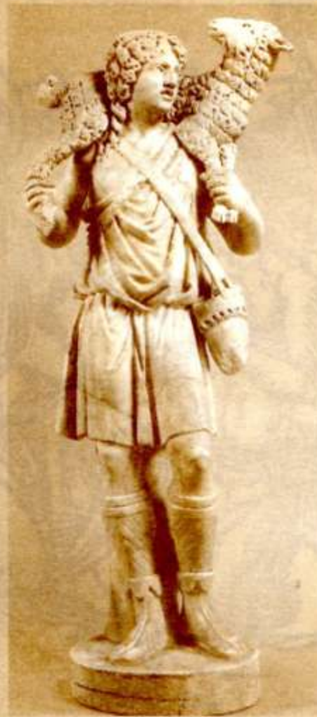
Escultura del Buen Pastor. Museo de Letrán. •