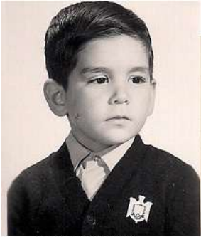
5 años (escuela)