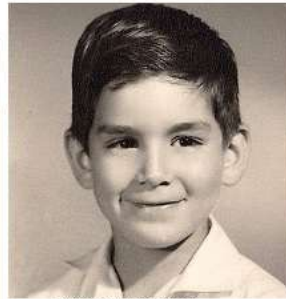
7 años (escuela)