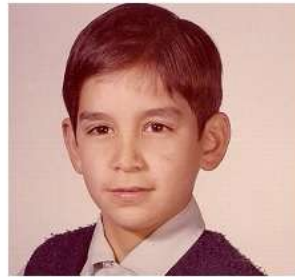
10 años (escuela)