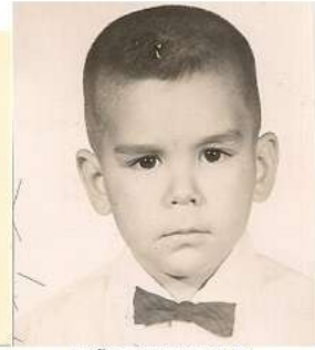
4 años (nuevo corte)