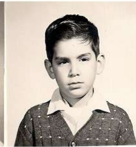
8 años (pensador)