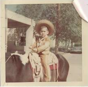
6 años (charro en caballo)