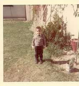
3 años (Domingo)