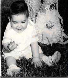
1 año (cumpleaños)

Asistí a un colegio de monjas frente a la casa donde crecí con mis hermanos y padres. Sonaba la campana y salía corriendo a la fila del salón para entrar a clase.