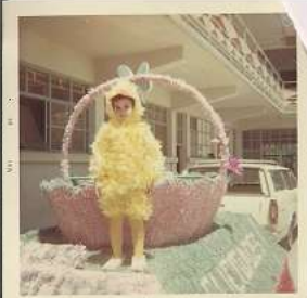
2 años (desfile de pascua)