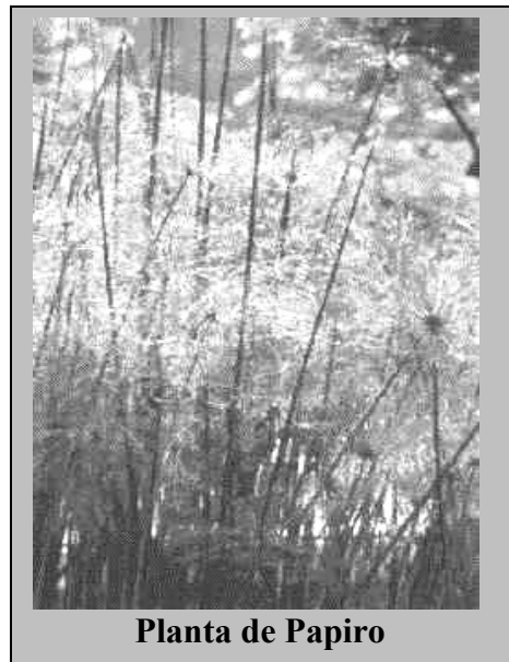
Planta de Papiro

En el siglo primero se escribía sobre papiros. El papiro se obtenía de la planta del mismo nombre. En el interior del tallo de la planta existen unos largos filamentos a partir de los cuales se elaboraban los papiros utilizados para la escritura. En la antigüedad los rollos de papiro constituían el vehículo más importante para la transmisión y conservación del conocimiento humano. La nación que ha conservado mayor número de papiros es Egipto. Ello se debe a que el papiro sólo resiste largo tiempo en climas muy calientes y secos.