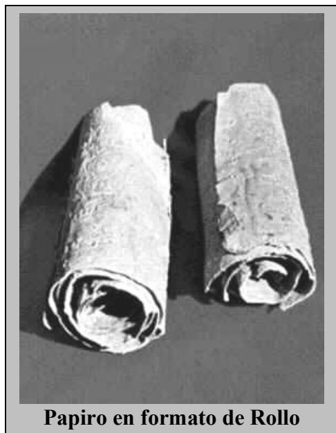
Papiro en formato de Rollo

Sólo siglos después (en el siglo IV) comenzará a utilizarse el pergamino, formado por piel de animales, las cuales, convenientemente tratadas, se reducían a hojas finas y lisas.