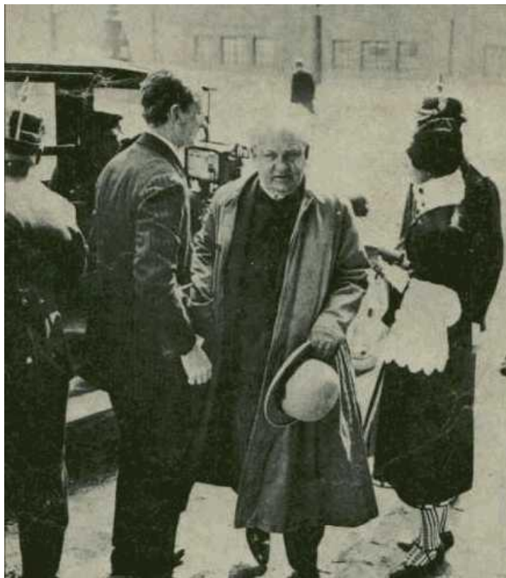
Baron Von Sedotendorf, maestro de la logia de Thule

se encontraba en diversas partes del mundo desde donde la raza blanca divina habría irradiado su mágica influencia hasta decaer por medio del pecado racial en la raza blanca tal como la conocemos hoy en día. Thule, de ser una especie de club social pasó a convertirse en una sociedad del tipo esotérica que buscaba a través de la Antroposofía el conocimiento del origen divino de la raza blanca.