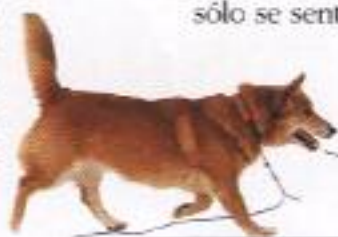
El perro vuelve a buscar su juguete favorito

Recompense siempre a su perro cuando se porte bien, pero no espere que le obedezca la primera vez que le dé una orden. No obstante, los perros aprenden pronto a asociar ciertas palabras con reacciones y premios específicos.