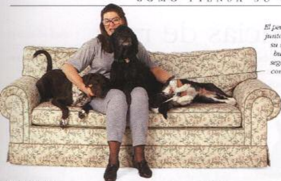
El perro se acoba junto al jefe de su manada buscando seguridad y comodidad