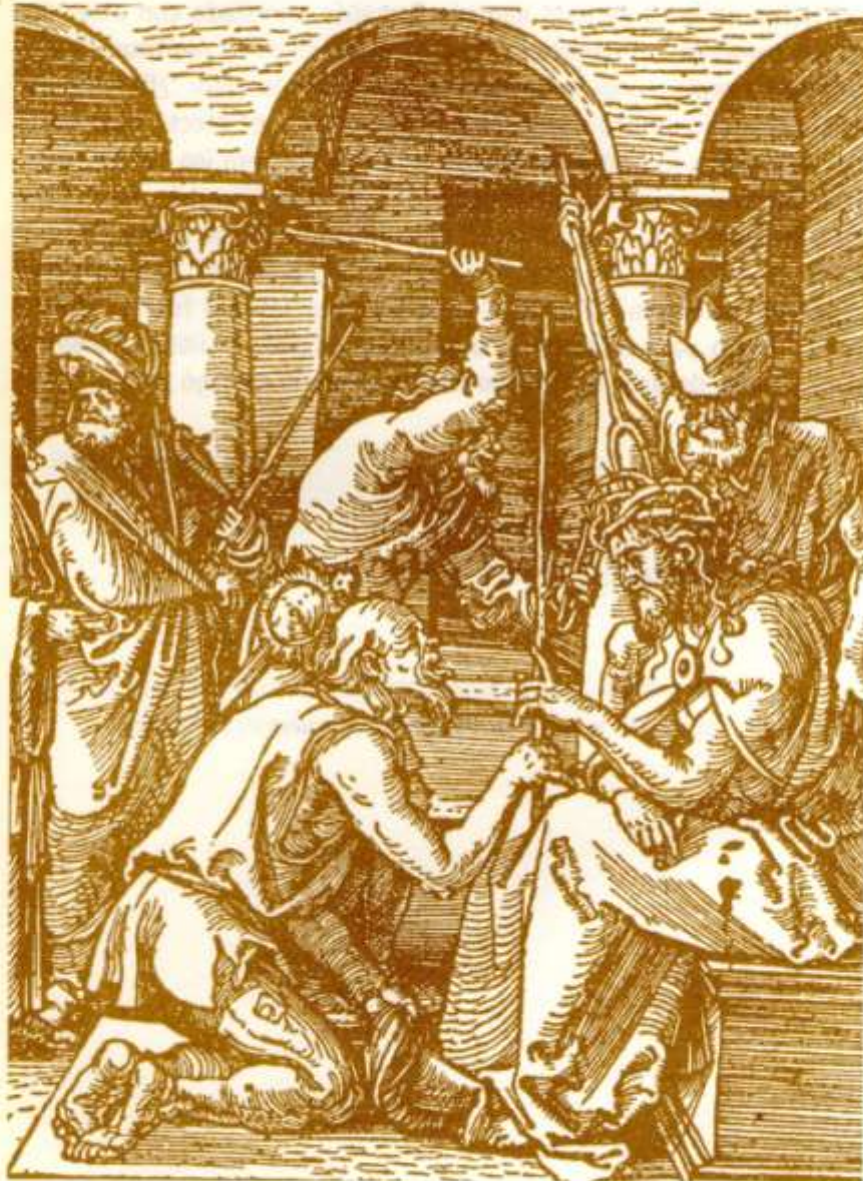
Xilografía de Alberto Durero (1471-1528)