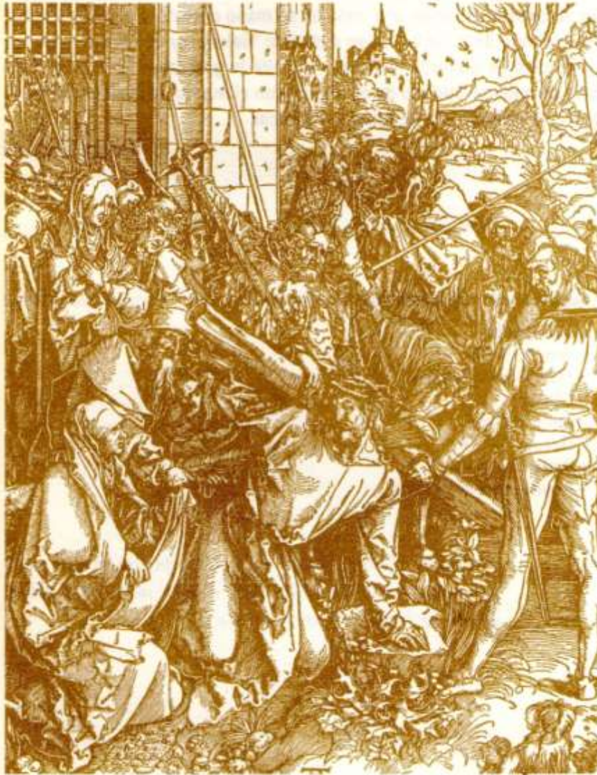
Xilografía de Alberto Dürero (1471-1528)