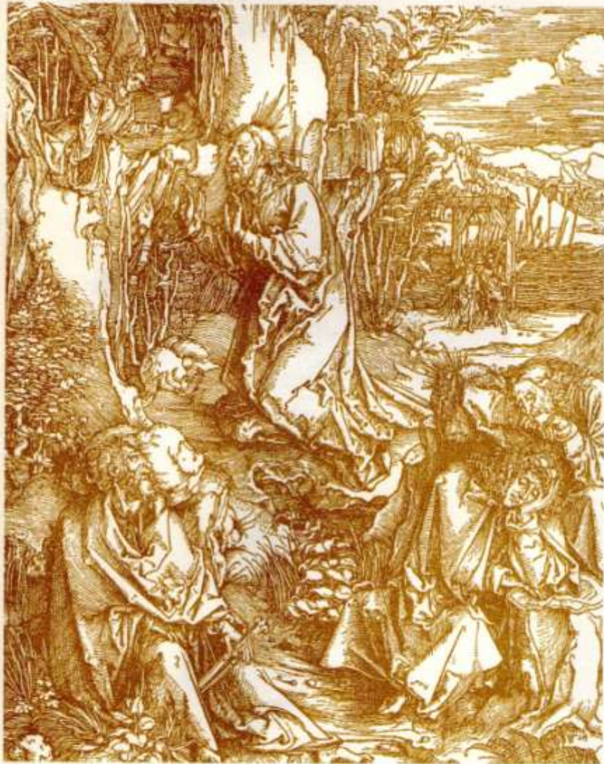
Xilografía de Alberto Dürero (1471-1528)